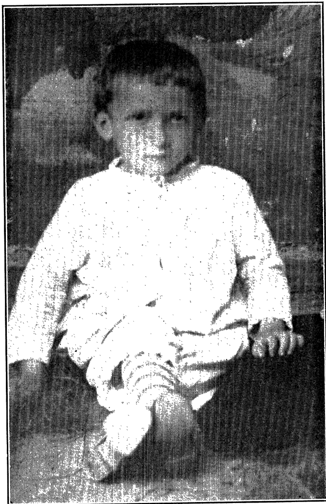
באַרצכאַוו אַלס קינד פון דריי יאָר (1884)